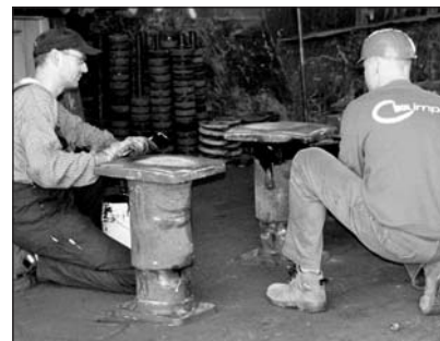
Vorher: Arbeiten in knieender Position.

Nachzuweisen ist ein gesunkener Krankenstand sowie geringere Kosten für Krankenhausaufenthalte und Medikamente. Der BetriebsCHECK-UP Rücken leistet hierzu einen wichtigen Beitrag. ●