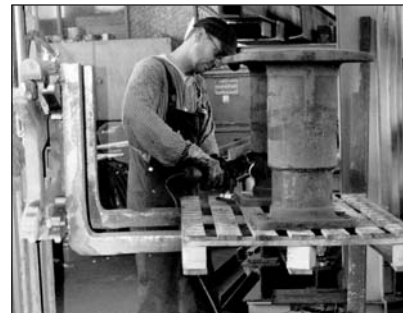
Nachher: Puffer in die richtige Arbeitshöhe gebracht