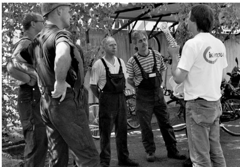
Zuerst werden Grundkenntnisse zum Rücken vermittelt.

auch Zeit- und Termindruck, Unzufriedenheit mit der Arbeit oder ein schlechtes Betriebsklima beeinträchtigen Rücken und Gesundheit.