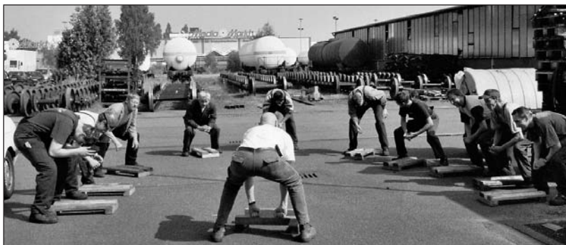
Gemeinsame Bewegungspause mit Hebe- und Tragetaining.

Nach der Durchführung des BetriebsCHECK-UP Rücken wurden darüber