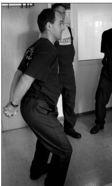
Die Anleitung zu einer Bewegungspause wird eingeübt.

Dass der Rücken im Mittelpunkt der Schulung steht, liegt daran, dass Erkrankungen der Wirbelsäule die häufigste Ursache von Arbeitsunfähigkeit sind. Klassische Ursachen wie schweres Heben und Tragen, Arbeiten in ungünstiger Körperhaltung oder unergonomische Gestaltung von Arbeitsplätzen führen zu Rückenproblemen. Aber